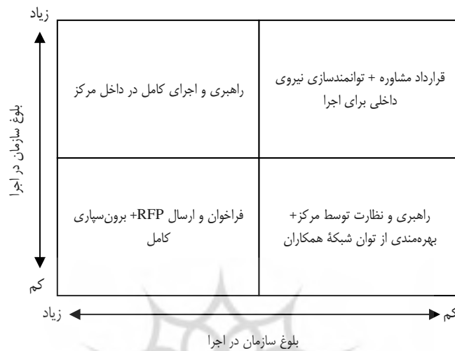
شکل ۲. طبقه‌بندی نحوه مدیریت اجرای برنامه‌ها بر مبنای منطق TRL

که قابلیت اقتصادی در محیط سازمان و بلوغ سازمان (منابع انسانی، فیزیکی و مالی) در اجراها را بر مبنای دو معیار، در چهار گروه مطابق شکل ۲ دسته‌بندی می‌کند.